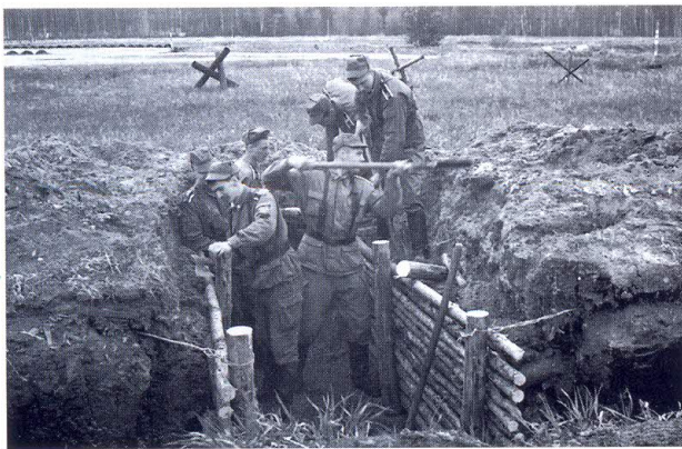
Строительство тактического поля. 1991 г.